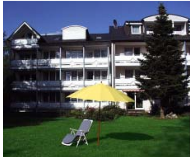
Haus Katharina *** 9 km familiär geführtes Hotel im Kurzentrum familiar led hotel in the cure center www.haus-katharina.de