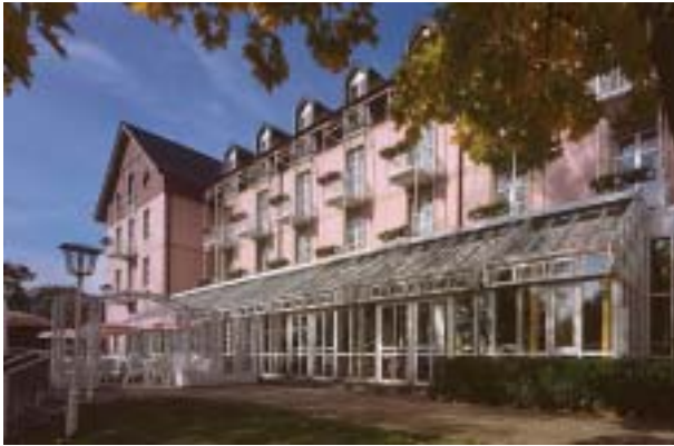
relexa hotel Bad Steben **** S 9 km Wellness-Hotel im Kurzentrum spa hotel in the cure center www.relexa-hotels.de