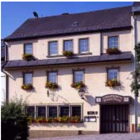
Hotel Grüner Baum 2 km im Zentrum von Naila in the center of Naila www.gruener-baum-naila.de